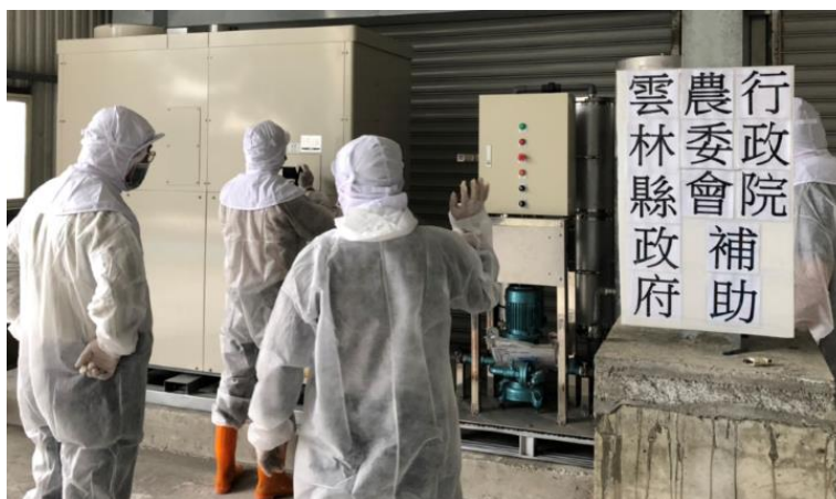
沼氣發電相關設備(施) 完工照片