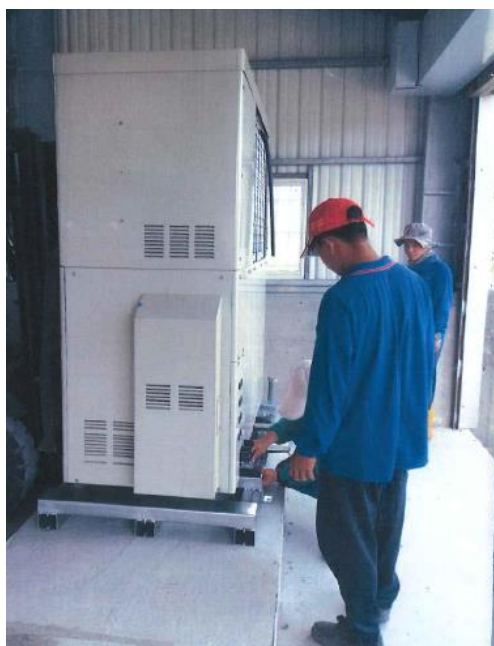
沼氣發電相關設備(施) 設置中照片